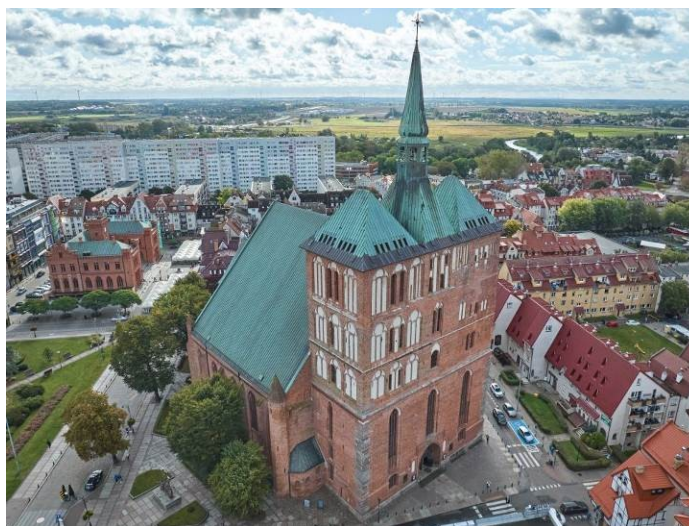
Widok z lotu ptaka od płn.-zach.