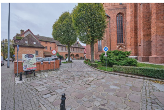
Widok działki od strony prezbiterium (wsch.)