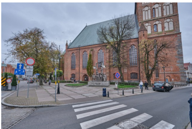
Widok działki od północy

7. Fotografia z opisem wskazującym orientację albo mapa z zaznaczonym stanowiskiem archeologicznym