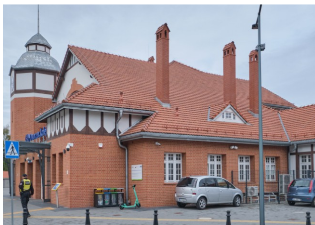
Widok ogólny bryły od strony południowo-wschodniej