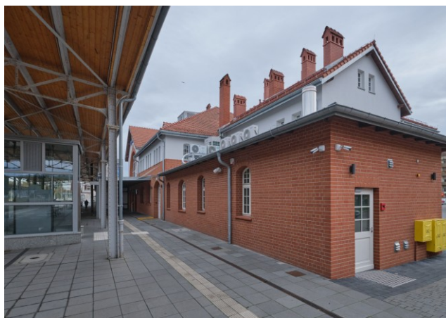
Widok na tylną część bryły (północną) od strony torów