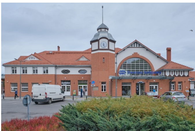
Widok frontowy bryły od strony południowej

7. Fotografia z opisem wskazującym orientację albo mapa z zaznaczonym stanowiskiem archeologicznym