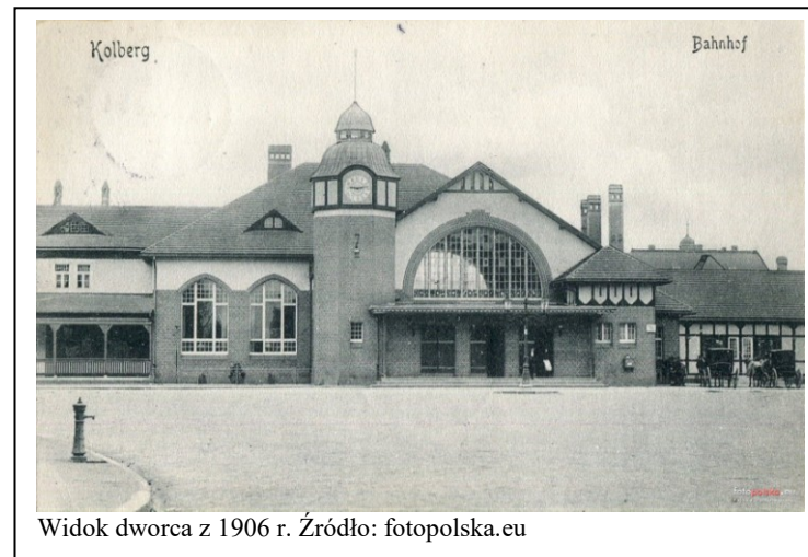
Widok dworca z 1906 r.

- wszelkie prace budowlano-konserwatorskie winny być uzgadniane z MKZ w Kołobrzegu. Obowiązuje zachowanie: historycznej bryły, kompozycji i podziałów elewacji frontowej wraz z detalami wystroju architektonicznego, oryginalnych stolarek (okiennych, drzwiowych, balustrad schodów); w przypadku zniszczenia historycznej formy, przy wymianie wskazane jest odtworzenie pierwotnego kształtu i podziałów.