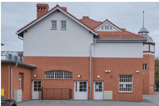
Widok ogólny bryły od strony zachodniej