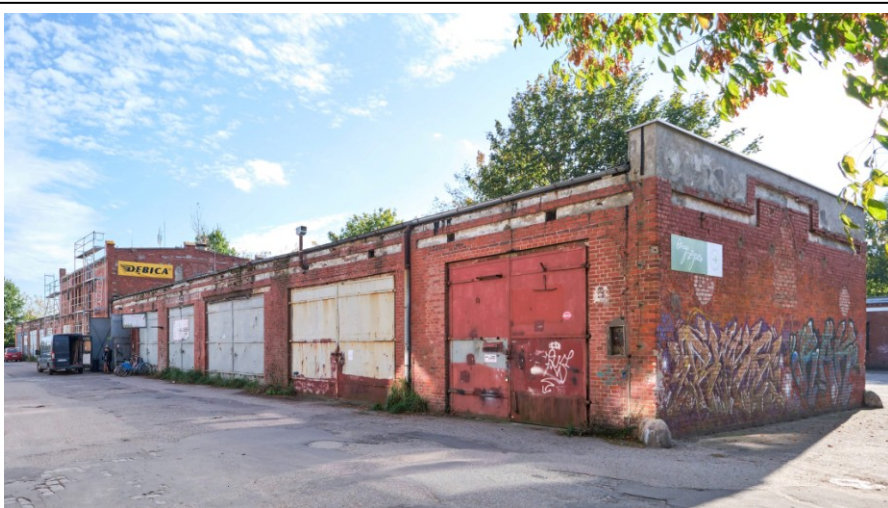
Widok ogólny od północy

7. Fotografia z opisem wskazującym orientację albo mapa z zaznaczonym stanowiskiem archeologicznym