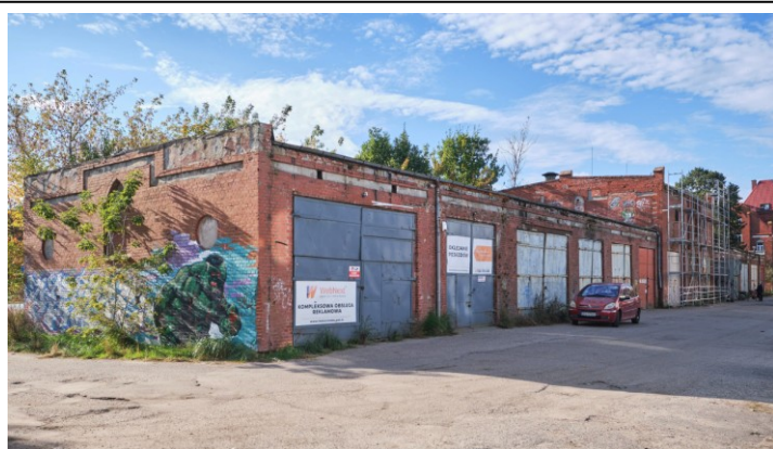
Widok ogólny od wschodu