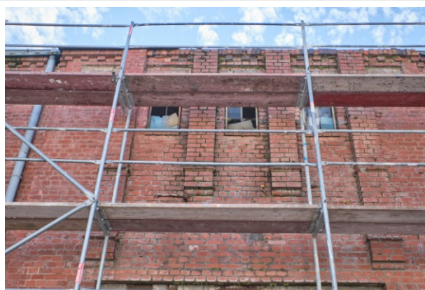
Ceglane lizeny pośrodku fasady