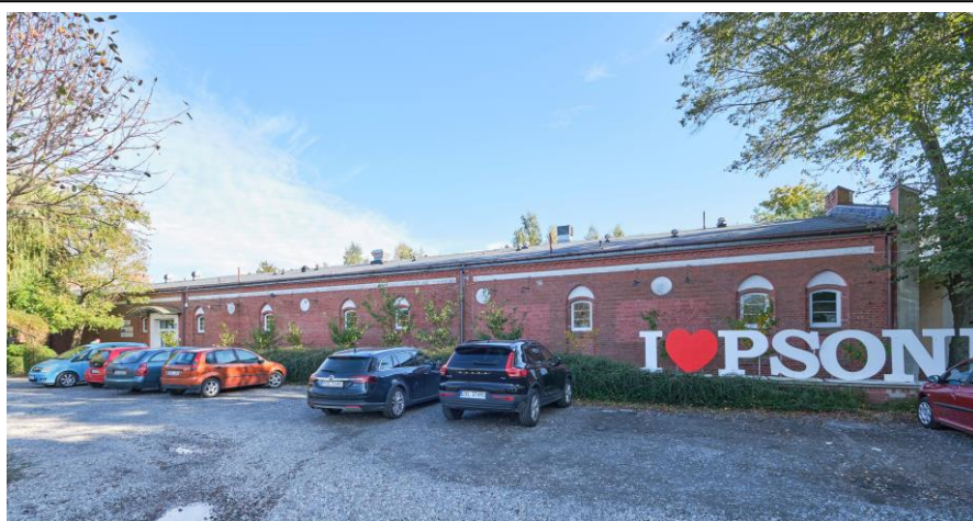
Widok ogólny od ulicy Mazowieckiej

7. Fotografia z opisem wskazującym orientację albo mapa z zaznaczonym stanowiskiem archeologicznym