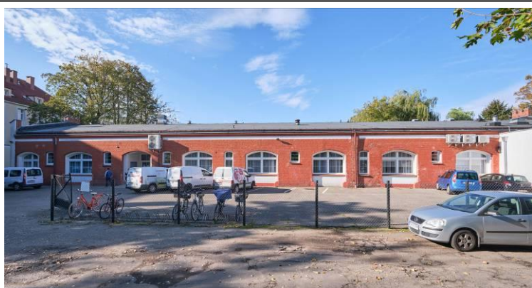
Widok ogólny od podwórza

Obiekt ujęty w Gminnej Ewidencji Zabytków na podstawie Zarządzenia Nr 87/14 Prezydenta Miasta Kołobrzeg z dn. 21.10.2014 r. (aktualizacja: zarządzenie nr 101/22 z dn. 26.08.2022 r.)