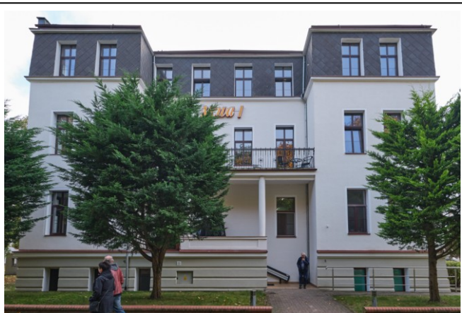
Widok elewacji frotowej, północnej