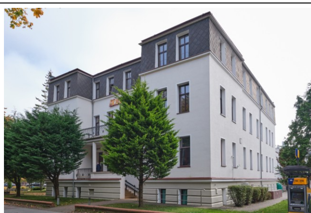
Widok ogólny bryły od strony północno-zachodniej