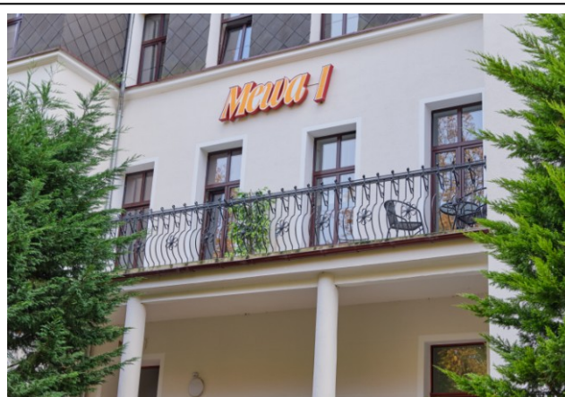
Środkowa część fasady z tarasem balkonowym