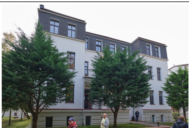
Widok ogólny bryły od strony północno-wschodniej

7. Fotografia z opisem wskazującym orientację albo mapa z zaznaczonym stanowiskiem archeologicznym