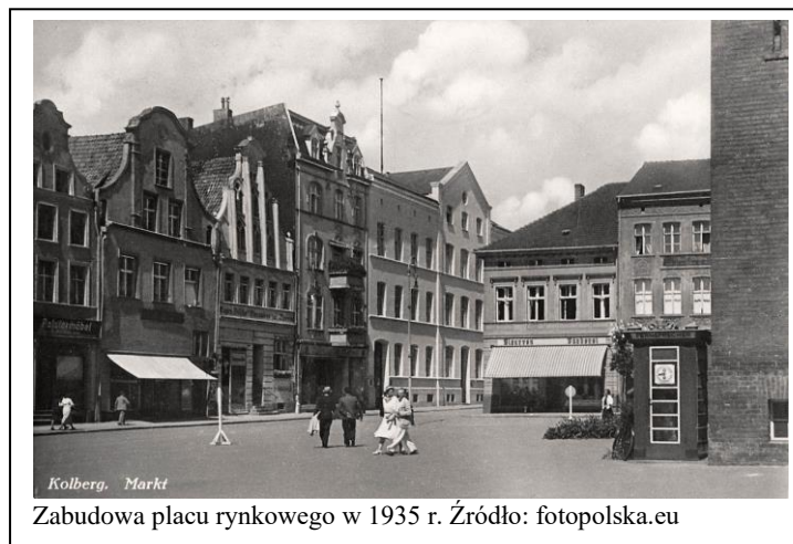
Zabudowa placu rynkowego w 1935 r.

Uwaga: Zakres obszaru objętego ścisłą ochroną konserwatorską (wpisem do rejestru zabytków) wytyczony jest po linii tylnej granicy obrzeżnych działek budowlanych.