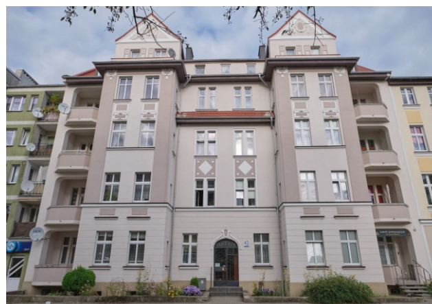
Widok na elewację frontową południową