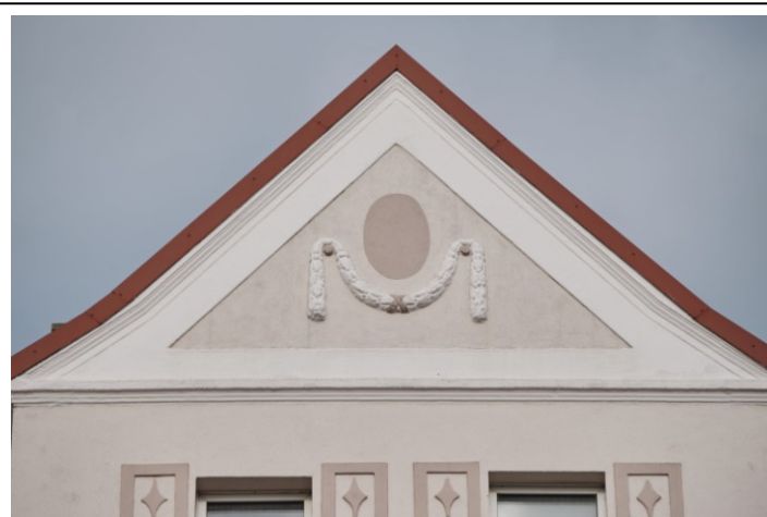
Fragment fasady, dekoracja szczytu wystawki dachowej

Obiekt ujęty w Gminnej Ewidencji Zabytków na podstawie Zarządzenia Nr 87/14 Prezydenta Miasta Kołobrzeg z dn. 21.10.2014 r. (aktualizacja: zarządzenie nr 101/22 z dn. 26.08.2022 r.)