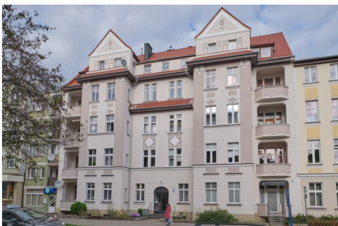
Widok ogólny bryły od strony południowo-wschodniej

7. Fotografia z opisem wskazującym orientację albo mapa z zaznaczonym stanowiskiem archeologicznym