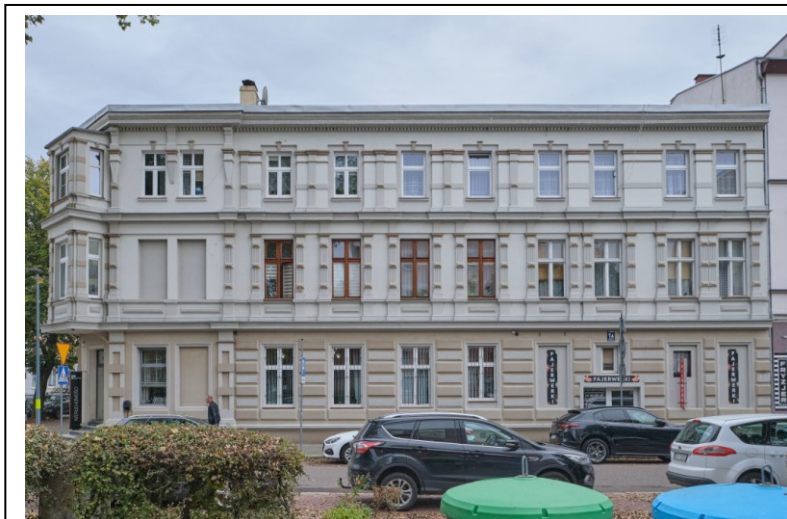
Fasada zachodnia, od strony ul. Źródlanej