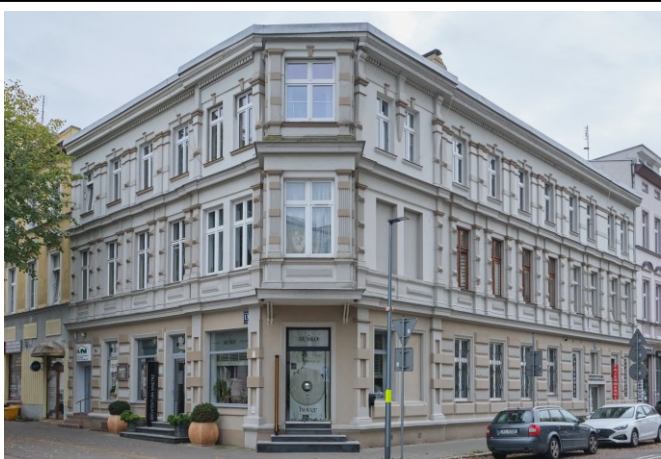
Widok ogólny bryły od strony północnej

7. Fotografia z opisem wskazującym orientację albo mapa z zaznaczonym stanowiskiem archeologicznym