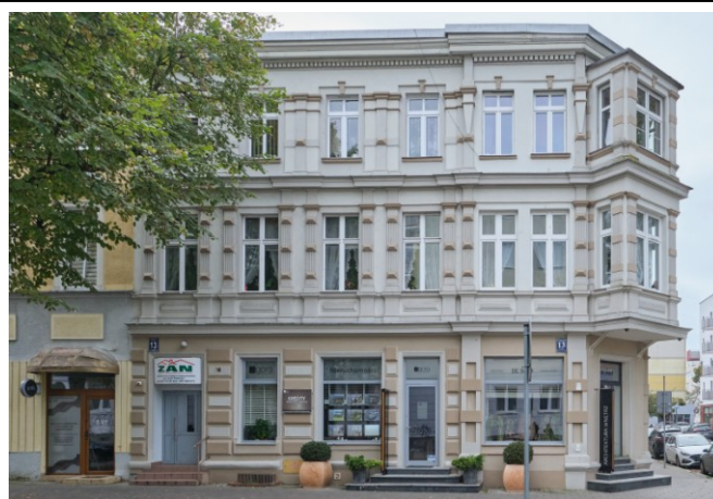
Fasada północna, od strony ul. Zwycięzców