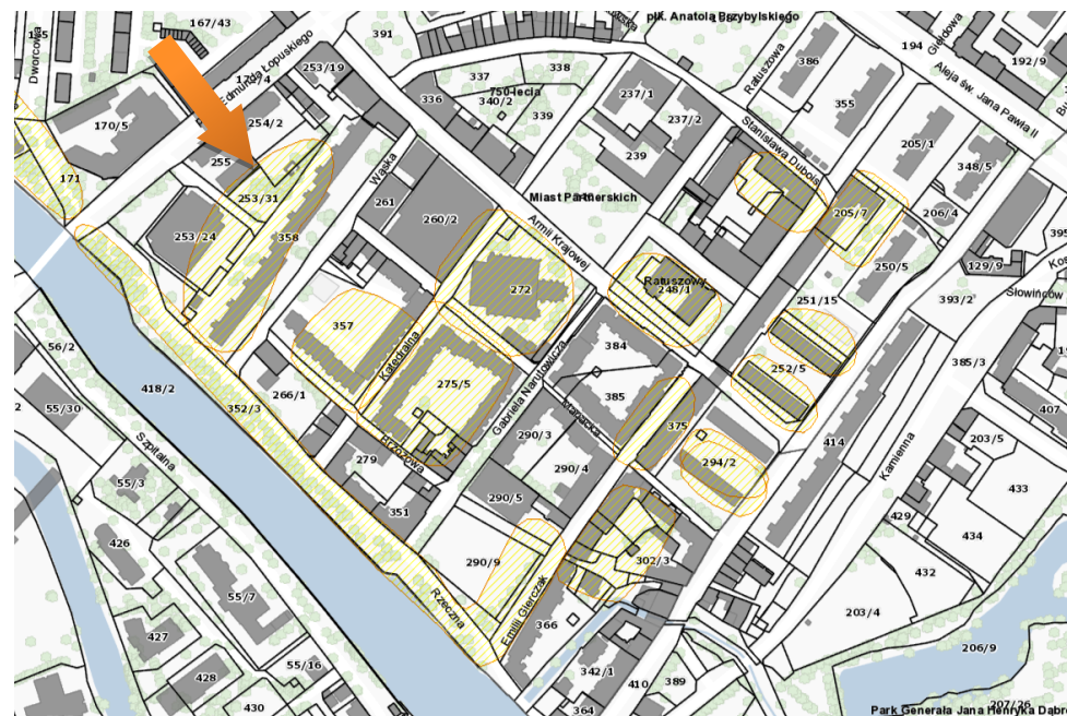
Obszar stanowiska na mapie – https://mapy.gis.kolobrzeg.pl

Ochrona polega na ograniczeniu ingerencji w grunt. Prowadzenie wszelkich prac związanych z ingerencją w grunt, w tym robót budowlanych wymaga uzyskania pozwolenia od wojewódzkiego konserwatora zabytków. W przypadku prowadzenia robót ziemnych, związanych z inwestycjami, należy przeprowadzić archeologiczne badania terenowe w niezbędnym zakresie, który zgodnie z art. 31 ustawy z dnia 23.07.2003 r. określi na wniosek inwestora wojewódzki konserwator zabytków.