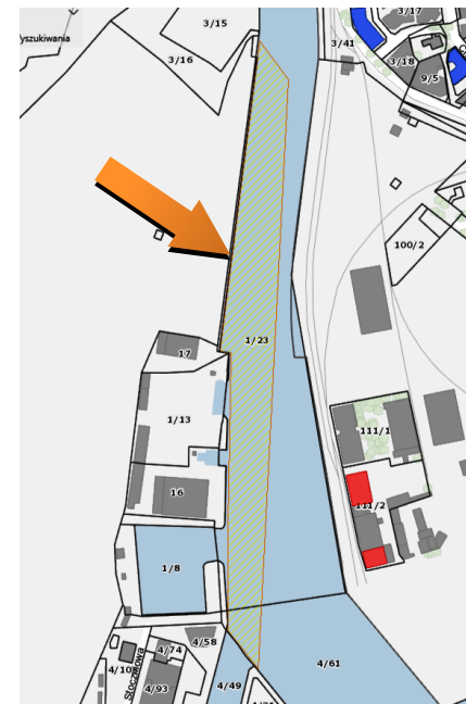
Obszar stanowiska na mapie – https://mapy.gis.kolobrzeg.pl

Ochrona polega na ograniczeniu ingerencji w grunt. Prowadzenie wszelkich prac związanych z ingerencją w grunt, w tym robót budowlanych wymaga uzyskania pozwolenia od wojewódzkiego konserwatora zabytków. W przypadku prowadzenia robót ziemnych, związanych z inwestycjami, należy przeprowadzić archeologiczne badania terenowe w niezbędnym zakresie, który zgodnie z art. 31 ustawy z dnia 23.07.2003 r. określi na wniosek inwestora wojewódzki konserwator zabytków.