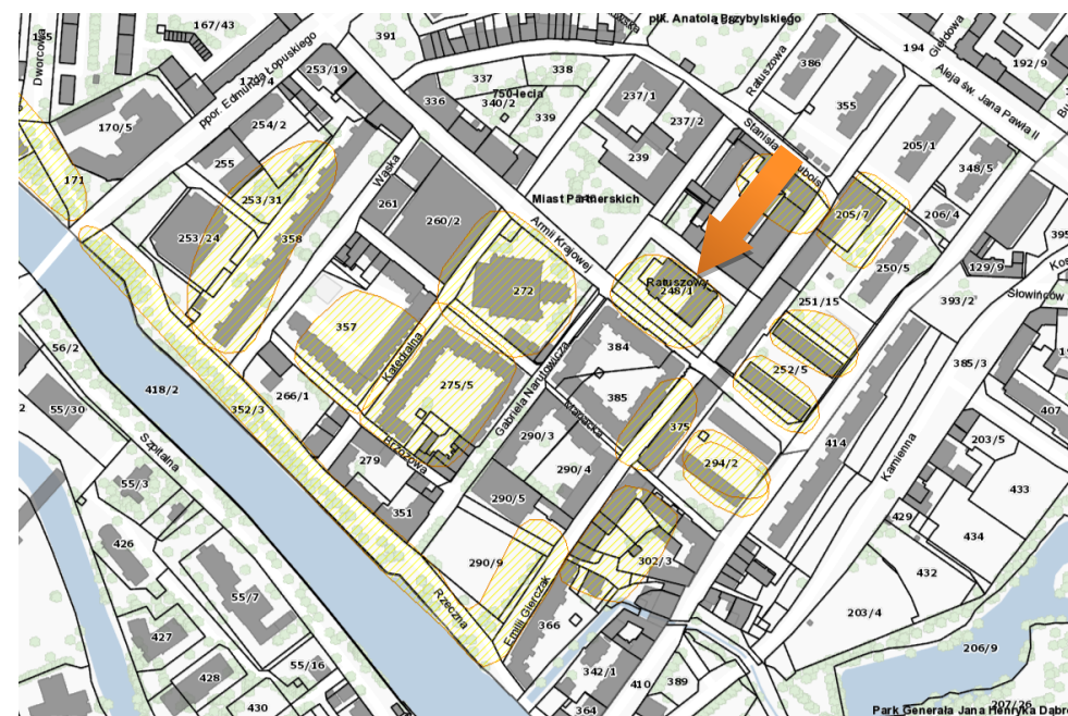
Obszar stanowiska na mapie – https://mapy.gis.kolobrzeg.pl

Ochrona polega na ograniczeniu ingerencji w grunt. Prowadzenie wszelkich prac związanych z ingerencją w grunt, w tym robót budowlanych wymaga uzyskania pozwolenia od wojewódzkiego konserwatora zabytków. W przypadku prowadzenia robót ziemnych, związanych z inwestycjami, należy przeprowadzić archeologiczne badania terenowe w niezbędnym zakresie, który zgodnie z art. 31 ustawy z dnia 23.07.2003 r. określi na wniosek inwestora wojewódzki konserwator zabytków.