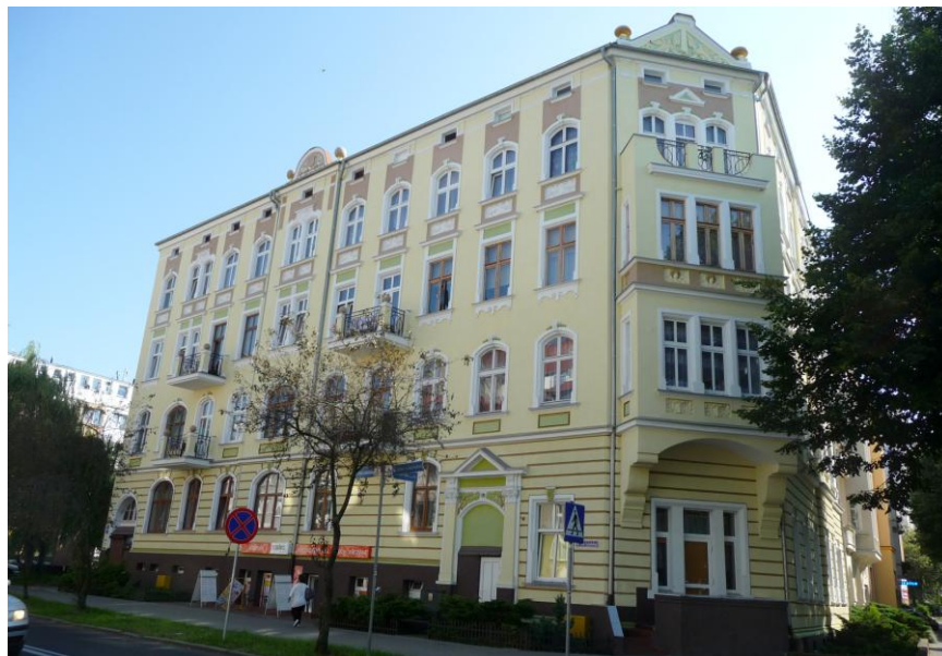
Widok budynku od północy

8. Fotografia z opisem wskazującym orientację albo mapa z zaznaczonym stanowiskiem archeologicznym