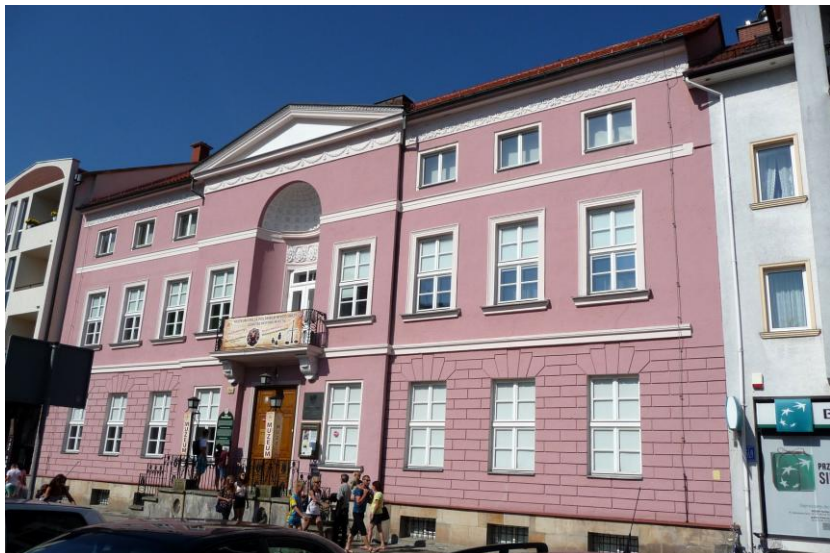
Widok budynku od południowego-zachodu

8. Fotografia z opisem wskazującym orientację albo mapa z zaznaczonym stanowiskiem archeologicznym