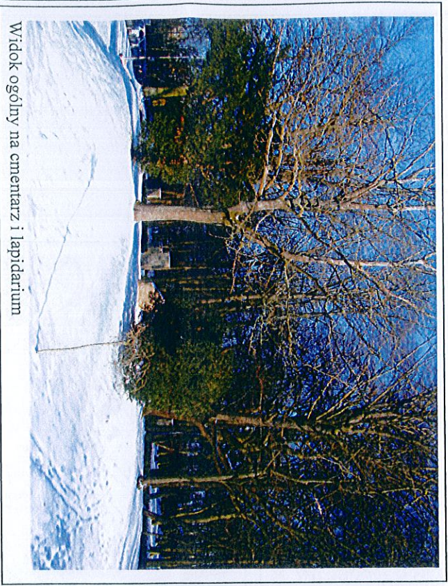
Widok ogólny na cmentarz i lapidarium