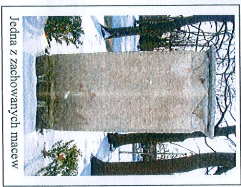
Jedna z zachowanych macew