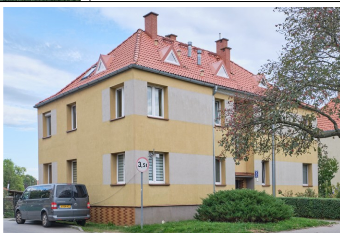
Widok ogólny od pñ.-zachodu