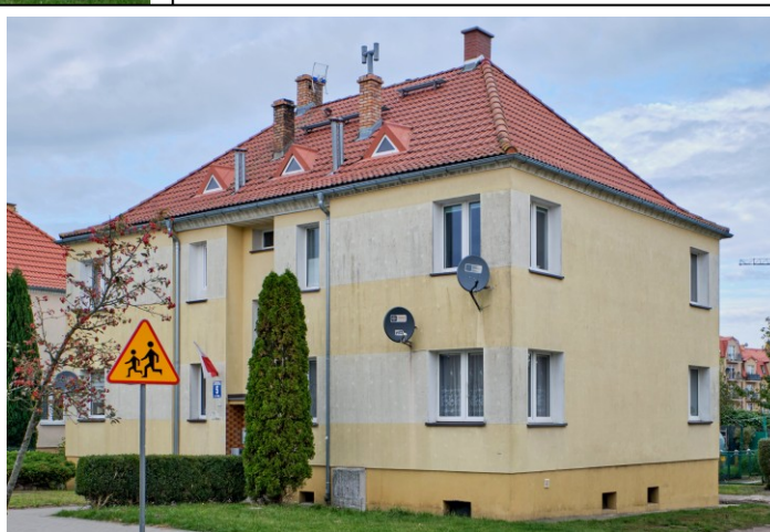
Widok ogólny od południa