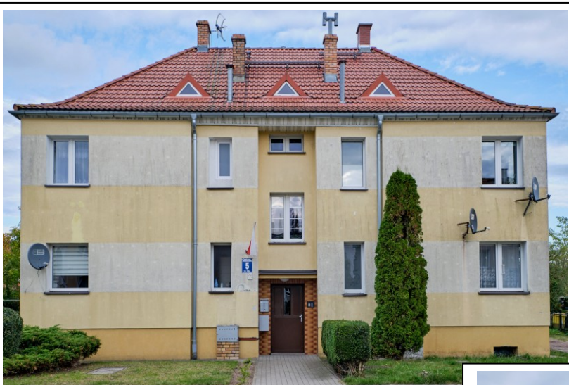
Elewacja frontowa - zachodnia

7. Fotografia z opisem wskazującym orientację albo mapa z zaznaczonym stanowiskiem archeologicznym