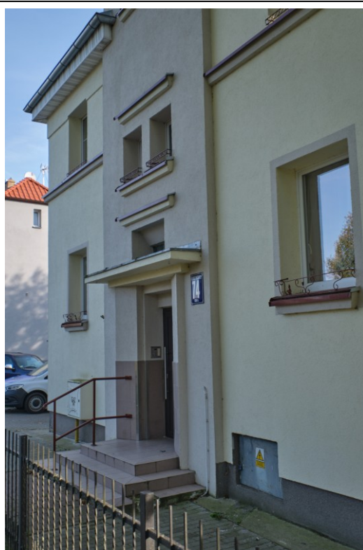
Elewacja frontowa – ryzalit