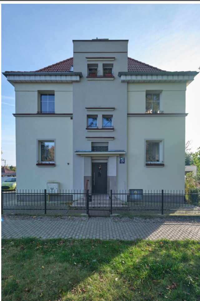
Elewacja frontowa - zachodnia

7. Fotografia z opisem wskazującym orientację albo mapa z zaznaczonym stanowiskiem archeologicznym