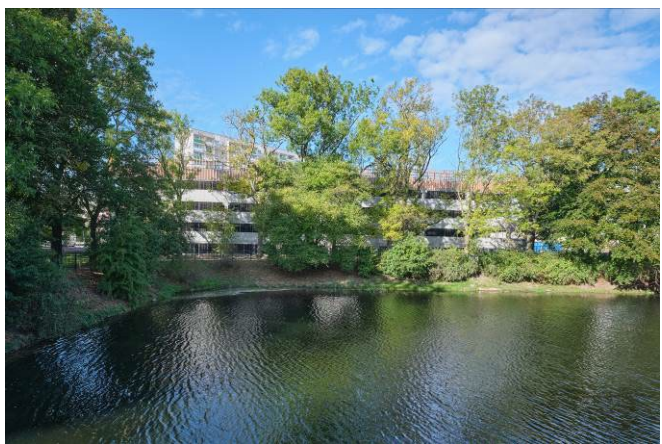
Widok ogólny od południa, z drugiej strony dawnej fosy.