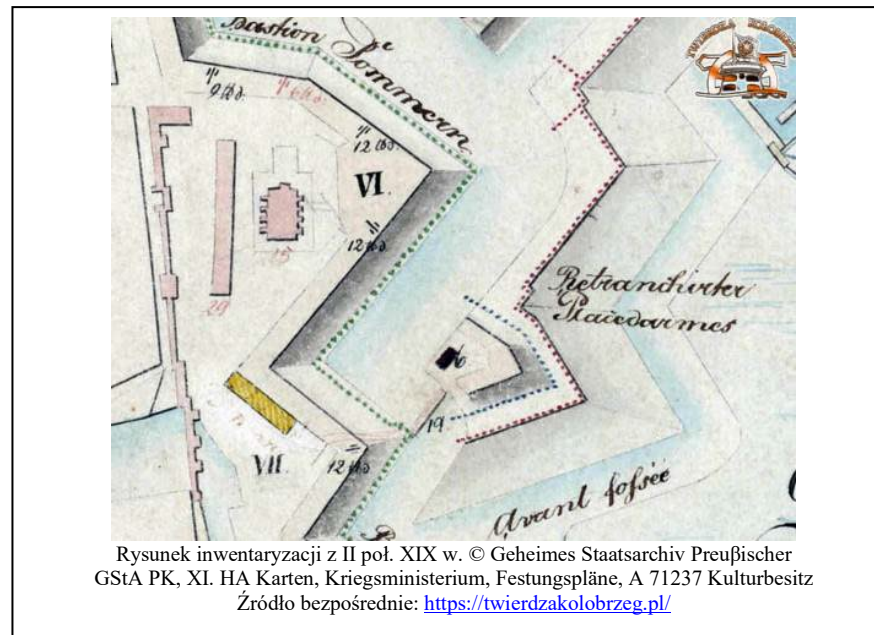
Rysunek inwentaryzacji z II poł. XIX w.

- wszelkie prace budowlano-konserwatorskie winny być zgodne z zapisami mpzp oraz uzgodnione z MKZ w Kołobrzegu. ochrona w zakresie zachowania: linii brzegowej dawnej fosy oraz szaty roślinnej i jej składu gatunkowego.