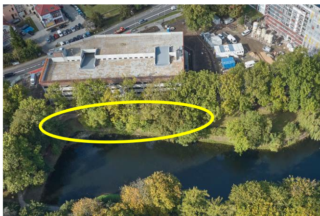
Widok ogólny z lotu ptaka od południa