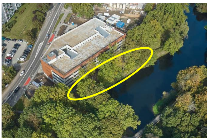
Widok ogólny z lotu ptaka od południowego zachodu

7. Fotografia z opisem wskazującym orientację albo mapa z zaznaczonym stanowiskiem archeologicznym