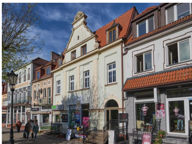
Widok ogólny bryły od strony południowo-wschodniej