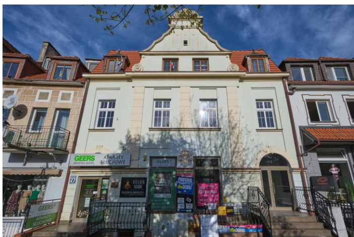
Widok frontowy kamienicy od strony południowej

7. Fotografia z opisem wskazującym orientację albo mapa z zaznaczonym stanowiskiem archeologicznym