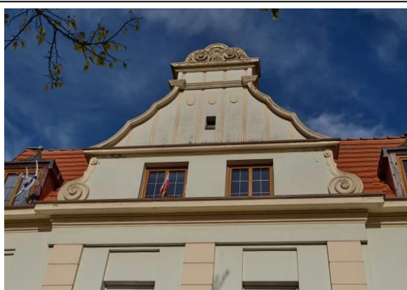
Fasada, szczyt wieńczący