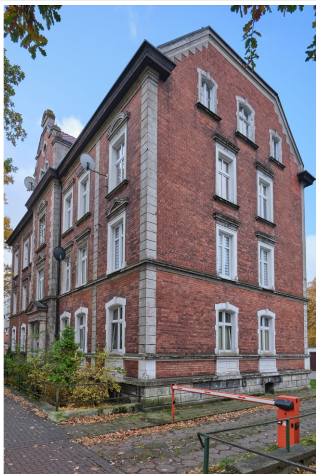
Widok ogólny bryły od strony północnej

7. Fotografia z opisem wskazującym orientację albo mapa z zaznaczonym stanowiskiem archeologicznym