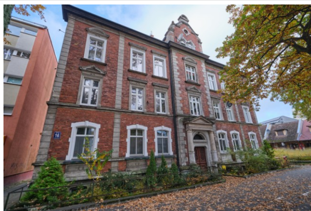
Widok na elewację frontową od południowego wschodu