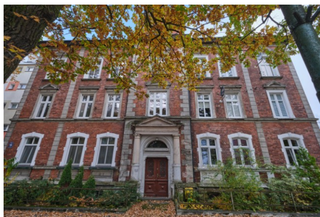
Widok na elewację frontową wschodnią